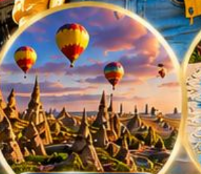
เมืองคัปปาโดเกีย Cappadocia