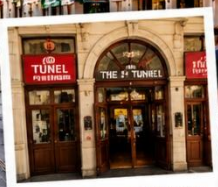
สถานีทูเนล (TUNEL STATION) สถานีรถไฟใต้ดินสายเก่าแก่ และเป็นหนึ่งในระบบขนส่งที่เก่าแก่ที่สุดในโลก