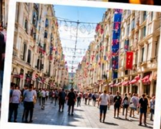
ISTIKLAL STREET (Grand Avenue of Pera) ถนนสายช้อปปิ้ง อิม บิล ครบจบในที่เดียว