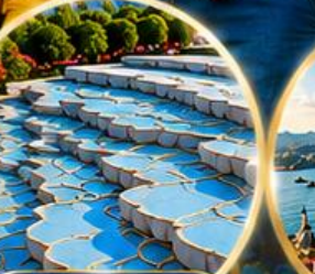
ปานุกคาล์ Pamukkale