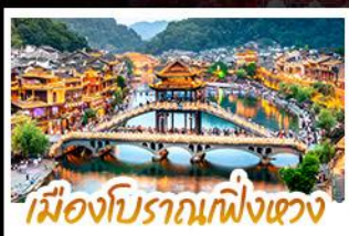
เมืองโบราณกึ่งเฉวง