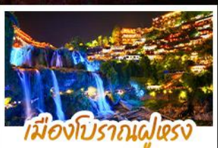
เมืองโบราณผู่เฉวง