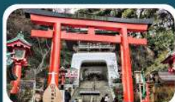
ศาลเจ้าอิโนะชิมะ

เดินทาง 01-05 ก.ค.69 15-19, 18-22 ก.ค.69 30 ก.ค.-03 ส.ค. 69