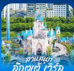
สวนสนุก คังจินเจ็ท วัลวิค