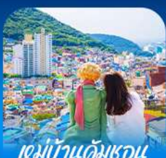
หมู่บ้านดัมชอน