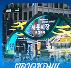
ตลาดชอมนุน