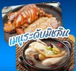
เมนูระดับมิชลิน

เดินทาง 02 - 07 ก.ย. 69 20 - 25 ส.ค. 69 17 - 22 ก.ย. 69