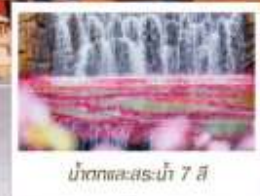
น้ำตกทะเลสาบไห่ 7 สี

🗳️ โหลด 23 KG. x1 ทิ้งไป - กลับ ✓ ฟรีนียบตัว ✓ ไม่เข้าร้านรัฐบาล ✓ ทีวีรูปเล็ก ✓ รวมค่าเข้าสถานที่ตามโปรแกรม