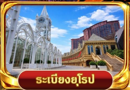
ระเบียงยุโรป