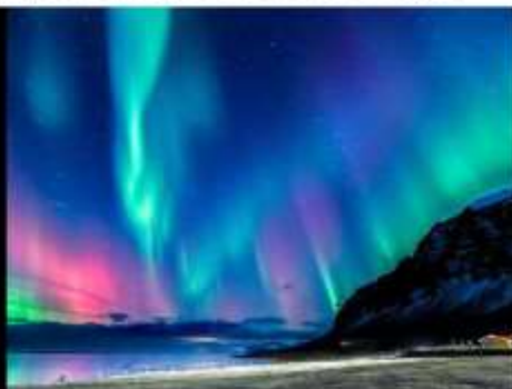
***รูปภาพเพื่อประกอบการโฆษณาเท่านั้น***