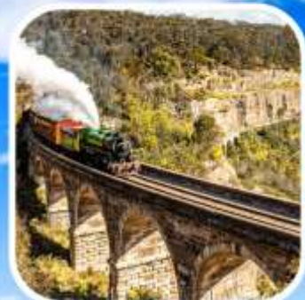
ZIG ZAG RAILWAY