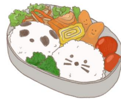
● อาหารสำหรับเด็ก ( 2-11 ปี ) *วัตถุประสงค์ขึ้นอยู่กับทาว์ราน