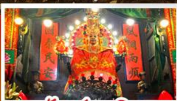
วัดเซกตงเหมียว