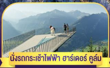
นั่งรถกระเช้าไฟฟ้า ชาร์เดอร์ คูล์ม