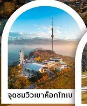
จุดชมวิวเขาค็อกโทเบ