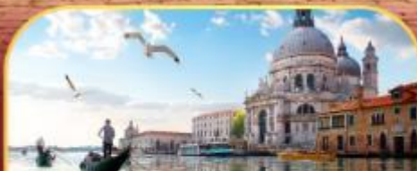
นั่งเรือสุทเกาะเวนิส