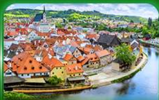
เมืองมรดกโลก เซสท์ครุมลอฟ