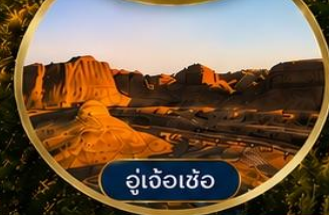
อู๋เจ้อเซ้อ