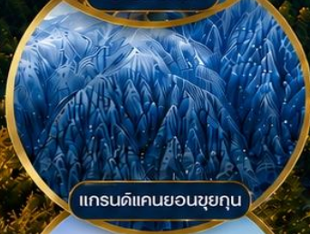
แกรนด์แคนยอนซุยกุณ