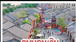
ถนนคนเดินสามครอกสองขอย