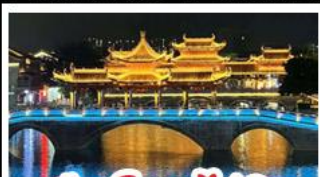
เมืองโบราณไท่ผิง

ส่งเรือน้ำตกเต๋อเทียน - ทำเรือกังจ้อ พาชมเขี้ยวสวนดอกไม้ตามฤดูกาล - หมู่บ้านสโตนฮิลล์ ถนนคนเดินสามครอกสองขอย - เมืองโบราณไท่ผิง กำแพงหลงกง เมนูพิเศษ อาหารเวียดนาม สุกี้หม่าล่า