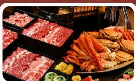
บุฟเฟ่ต์ซาซิมิ 3 ชนิด

เดินทาง 25-31 ต.ค.69 | 11-17 พ.ย.69 28 ต.ค.-03 พ.ย.69