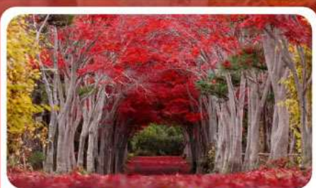
สวนลับชิราอิเกะ