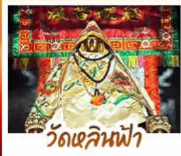
วัดเสกนัฟฟ้า