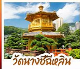
วัดนางชีฉีเสก