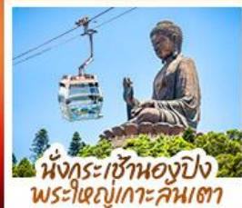
นั่งกระเช้าของปิง พระใหญ่เกาะคัมตา