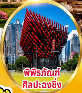
พิพิธภัณฑ์ ศิลปะฉงชิ่ง