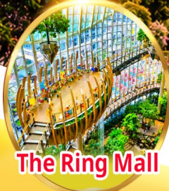
The Ring Mall