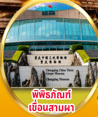
พิพิธภัณฑ์ เขื่อนสามผา