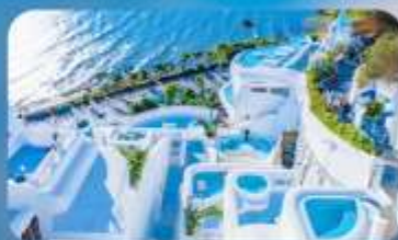
ซาโตรินี่