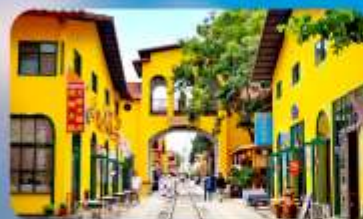
หมาหยวนมีเออร์เกจ