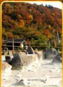
หุบเขานรกอุเซน

🌿 ออนเซ็น 2 คืน 🧳 นน.กระเป๋า 1 ใบ 23 กก 🌞 7Days 5Night