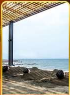
อาบน้ำร้อน