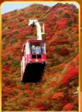
กระเช้าลอยฟ้าอุเซน