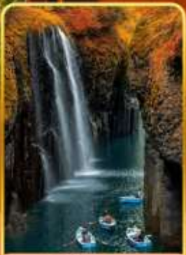
ทาคาจิโอะ(ไม่รวมสองเรือ)