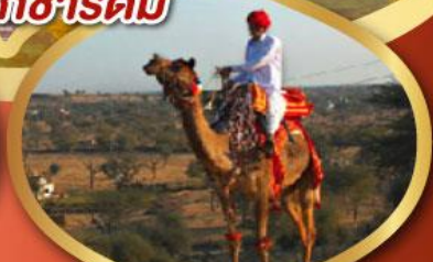
ฟรี ทัชมาฮาล เมืองมันทาวา ราคาเริ่มต้น