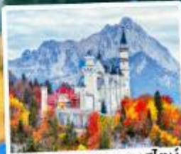
ปราสาทน้อยชวานสไตน์