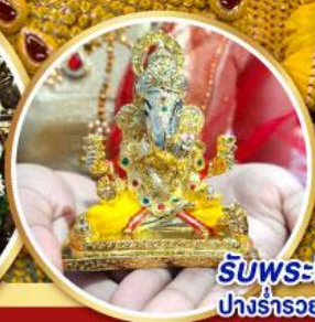
รับพระพิฆเนศปางรำรอย ท่านละ 1 องค์