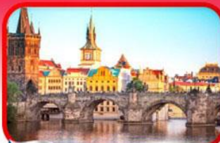
เขื่อนอินสะพานชาร์ลส์