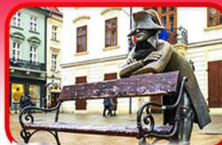
ย่านเมืองเก่าราติสลาวา

เที่ยวเมืองสวยริมทะเลสาบ ฮัลล์สตัดท์ • ชมเมืองไข่มุกแห่งโบฮีเมีย เซสกี กรุงลอน • ปราสาท • เวียนนา • ซอปปิงพาร์นดอร์ฟ เอาก์เล็ท