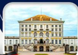
พระราชวังนิมเฟนบวร์ก