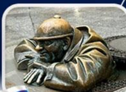
ประติมากรรม Cumil

มาเรียนพลักซ์·บ้านเกิดโมสาร์ท·พระราชวังฮอฟบวร์ก·ซาลส์บวร์ก·บ้านเกิดโมสาร์ท·เกรโกเดร์สตรีก·ทะเลสาบคอนิกซี·หมู่บ้านอัลล์สตัดท์·อนุสาวรีย์มาเรียเทเรซา