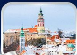
เมืองเชสกี้ กลุมลอฟ