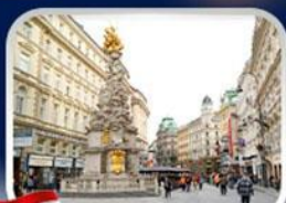
ช้อปปิ้งคาร์เทเนอร์สตรีก