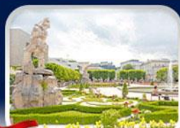
สวนมิรานิล ซาลซ์บวร์ก