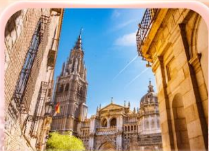
มหาวิหารแห่งโกเอลดา

ซาคราฟา ที่ว่ายิ่งใหญ่ ยังไม่ทำใจ...ก็ให้เธอไปหมดแล้ว