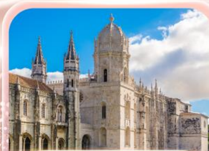
มหาวิหารเจโรนิโม