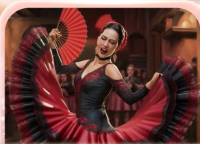
ระบำฟลามิงโก